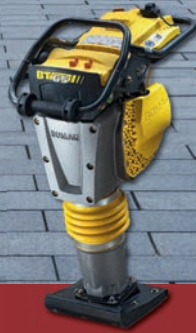
Bomag Stampfer BT65