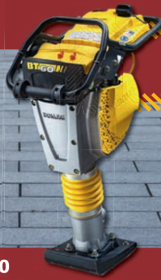
Bomag Stampfer BT60