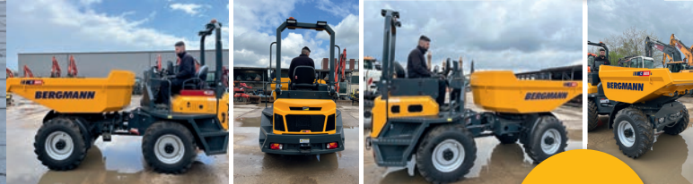
Bergmann Dumper C805