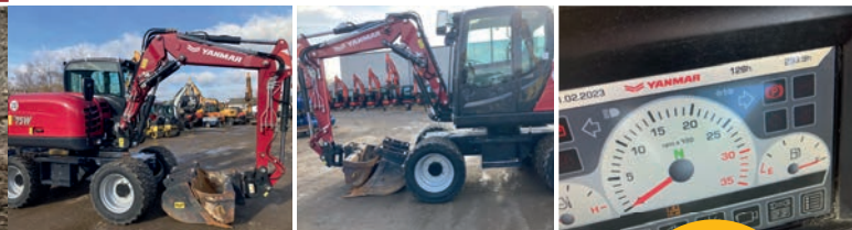
Yanmar Mobilbagger B75W

Baujahr: 2022 Betriebsstunden: ca. 400 Inkl. Powertilt und Löffelpaket