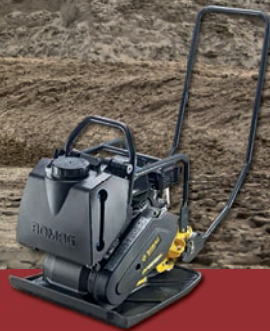
Bomag Rüttelplatte BP 20/50