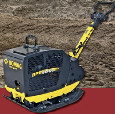
Bomag Rüttelplatte BPR 60/65 DE